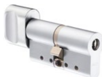
Cylindre à bouton